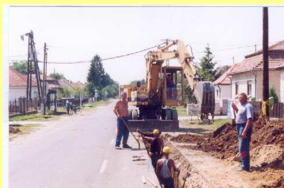
Horkai település részen folyó munkálatok