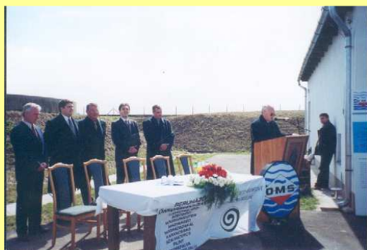
Szennyvíz beruházás indítása

Az eredményeink kézzel foghatóak, de nem lehetünk elégedettek. Sok- sok feladat van még hátra. Igaz, ezek már kisebb léptékűek. Javarászkunk a falunk megjelenését, esztétikáját, az utazó számára Ludányhalászi vizuális megítélését hozza majd kedvező helyzetbe.